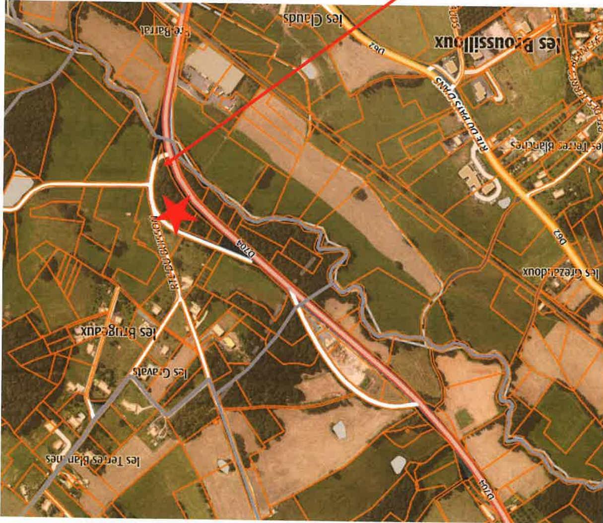
Terrain proposé pour la délocalisation de l'entreprise, indiqué par l'étoile rouge sur ce plan

On accède au terrain par la route communale du Buisson qui conduit au hameau situé juste au-dessus. Sur ce plan, on aperçoit l' ancien tracé de la RD 704 qui est aujourd'hui intégré dans le terrain comme on peut le constater sur la photo ci-dessous.