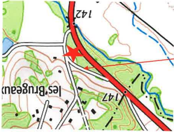
Situation de l'ancien tracé sur ce plan

L'ancien tracé est encore goudronné et se perd dans les broussailles au fond du terrain. Actuellement, on ne peut donc qu'emprunter la voie communale du Buisson pour se rendre sur les lieux du projet.