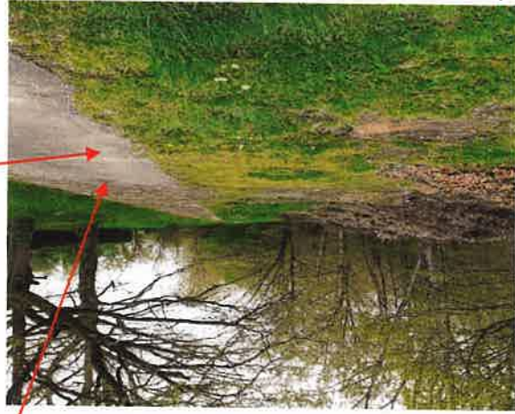
Photo du terrain avec l'ancien tracé de la RD 704

On accède au terrain par la route communale du Buisson qui conduit au hameau situé juste au-dessus. Sur ce plan, on aperçoit l' ancien tracé de la RD 704 qui est aujourd'hui intégré dans le terrain comme on peut le constater sur la photo ci-dessous.