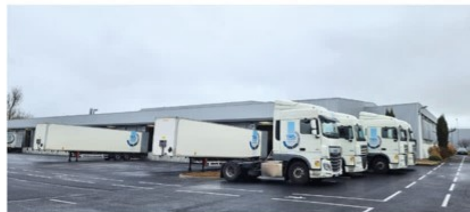
Installation de TRS en 2022 sur la ZAE du Coutal à Terrasson-Lavilledieu

Nous espérons que le contexte compliqué de crise énergétique, que nous subissons actuellement, ne viendra pas perturber l'essor économique que nous connaissons depuis ces 2 dernières années. Le service Economie et moi-même en profitons pour vous présenter nos meilleurs vœux pour la nouvelle année.